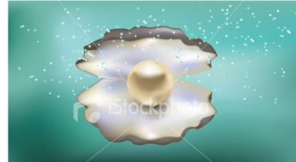
Pearl Exfoliator is made from entire cultured pearls